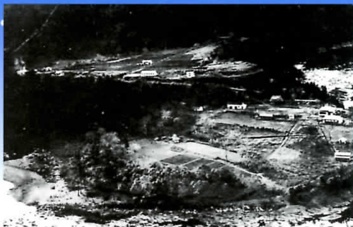
大正14年の「新しき村」(宮崎県)全景。家や宿所が点々とみえる。