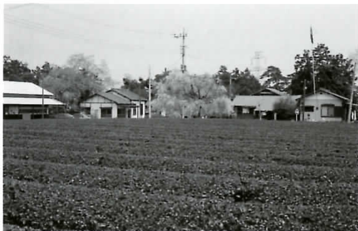
最近の「新しき村」(埼玉県毛呂山町)。手前はお茶畑、右に立つのは「新しき村」の旗。

今日では、経済的にも自立が達成され、若者十人の方々が「村の精神」のもと、稲作や養鶏などにいそいそと取り組まれています。平成十年、「新しき村」は創立八十周年を迎え、さまざまな記念行事が行われました。