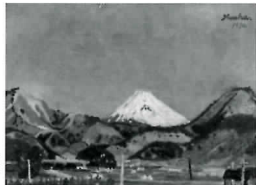
伊豆長岡より見た富士 昭和5年 実篤は昭和5年以来、たびたび伊豆長岡を訪れ、この地で多くの原稿や絵を手がけた。