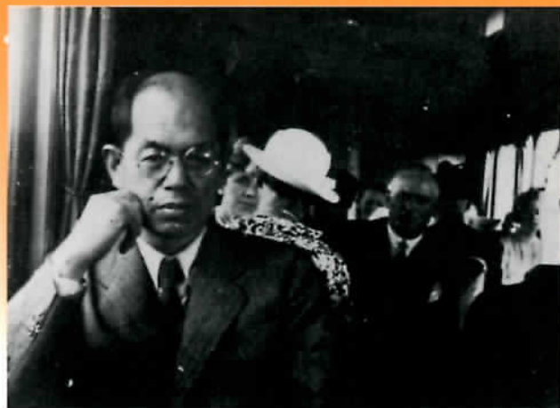
ドイツ・ハンブルグで 昭和11年 実篤は昭和11年4月から12月までヨーロッパとアメリカへ 旅行して、各地で美術館を訪ね、ピカソら当時活躍してい た芸術家に会った。「愛と死」にはこのときの経験が生かさ れている。