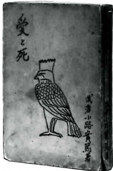
「愛と死」初版本（昭和14年 青年書房） 装幀は実篤。

「それは冷静に見れば一時の熱病なのかも知れない。しかしこの位獻身的な純な熱烈な感情というものは、人間は滅多に味わえるものではない。」