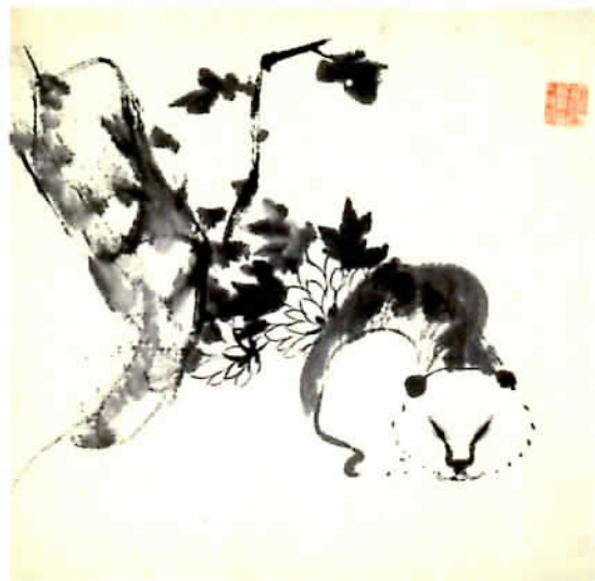
作品寸法：(各) 29.2 × 30.2 cm