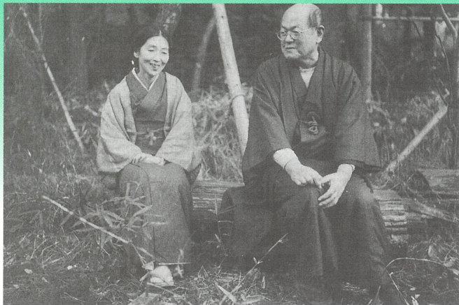
仙川の家で安子夫人と 昭和30年ころ