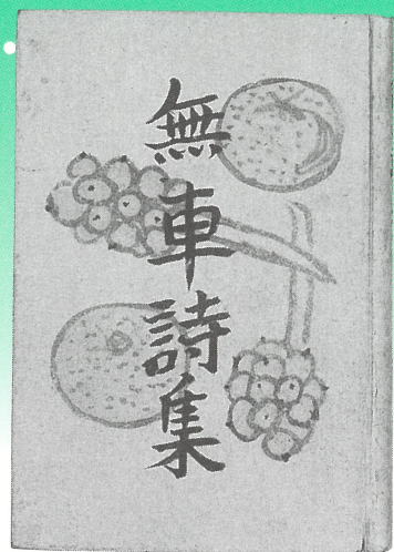
『無車詩集』昭和16年 甲鳥書