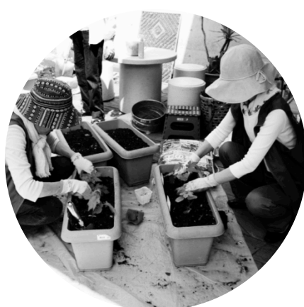
環境整備グループ

実篤や公園の見所について、1~5名位のお客様にガイドします。初めての方でも、養成講座や手引きがあるので安心です。